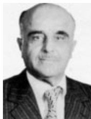
Air Chief Marshal O. P. Mehra

Depuis 1976: Air Chief Marshal O. P. Mehra*.