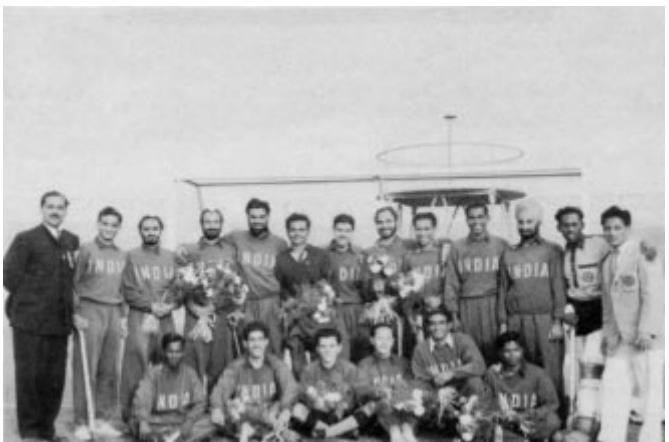
1952 - L'équipe victorieuse.