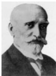
Sir Dorabji J. Tata