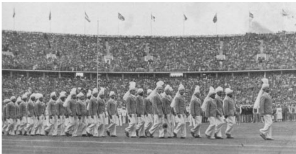
1936 - Berlin: la délégation indienne.