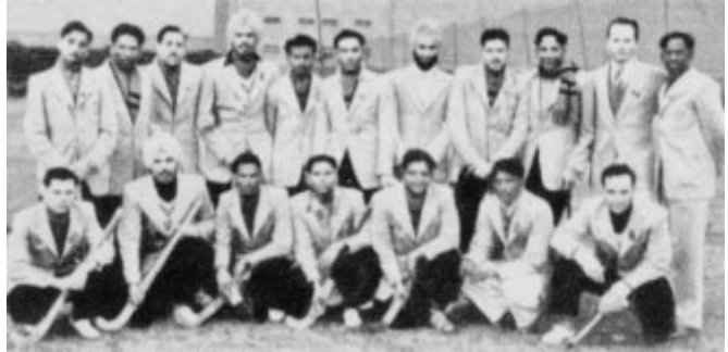
1948 - Londres: les champions indiens.