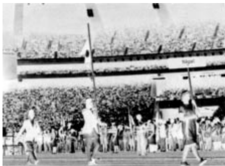
Montréal 1976: la délégation népalaise.

A ce jour, le Népal n'a pris part à aucune édition des Jeux d'hiver.