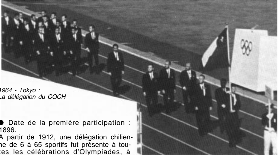
1964 - Tokyo : La délégation du COCH