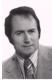
Sepp Blatter, secrétaire général

● M. J. Sepp Blatter, directeur du département technique, a été désigné comme secrétaire général de la FIFA.