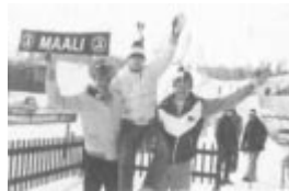
Urheilun vuosikirja 1980-81

Outre les résultats de toutes les compétitions des Jeux Olympiques depuis 1896 à Athènes jusqu'à 1980 à Moscou, cet ouvrage de compilation se distingue d'un annuaire statistique en donnant quelques informations sur la vie des principaux athlètes.