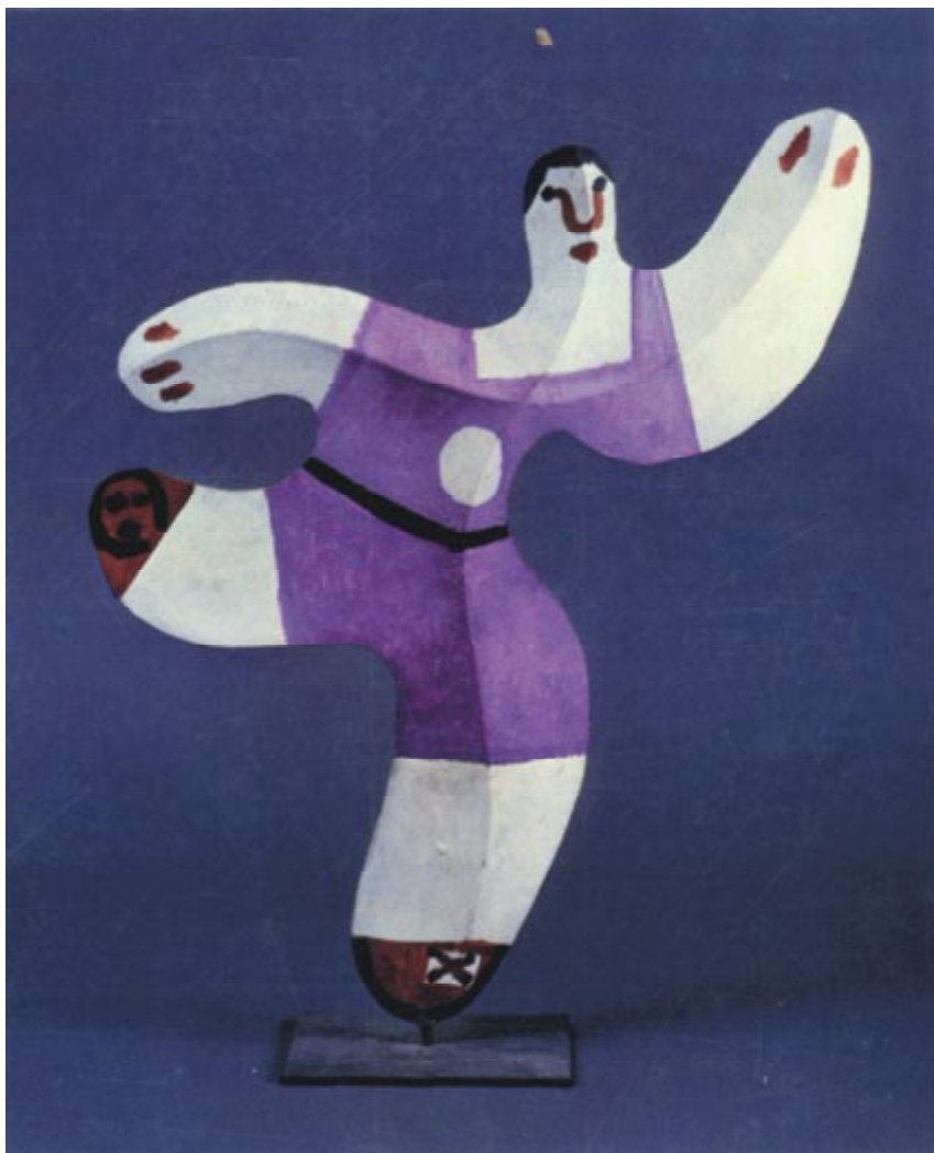
« Footballeur ». 1963. – Sculpture. Musée Picasso