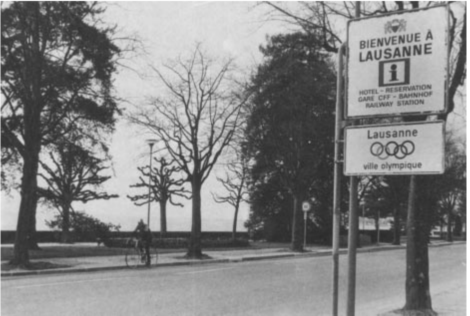
De nouveaux panonceaux «Lausanne - ville olympique» sont apparus en divers points de la capitale vaudoise.