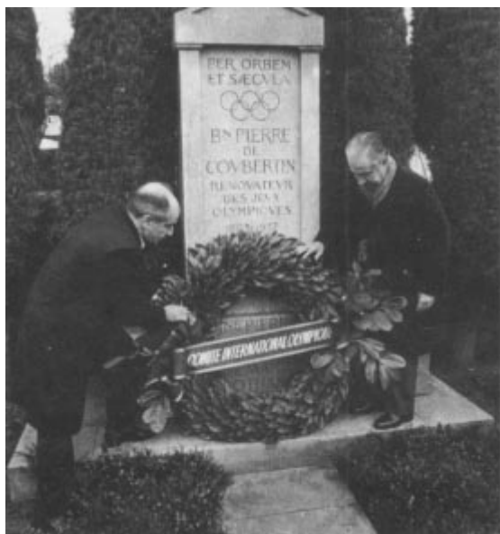
◀ M. Mohamed Mzali et M. Juan Antonio Samaranch, à l'occasion de la semaine olympique, déposent une gerbe sur la tombe du baron de Coubertin.