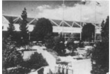
Pauley Pavilion, UCLA, Los Angeles