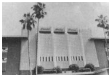
Santa Anita Park, Arcadia