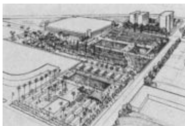
University of Southern California, Los Angeles