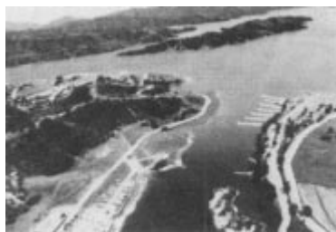
Lake Casitas, Ventura County