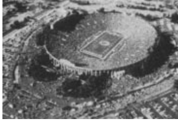
The Rose Bowl, Pasadena