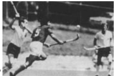
East Los Angeles College Stadium, Los Angeles