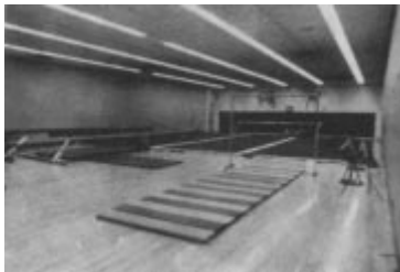
California State University, Fullerton, & California Polytechnic University, Pomona