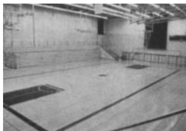
California State University, Los Angeles