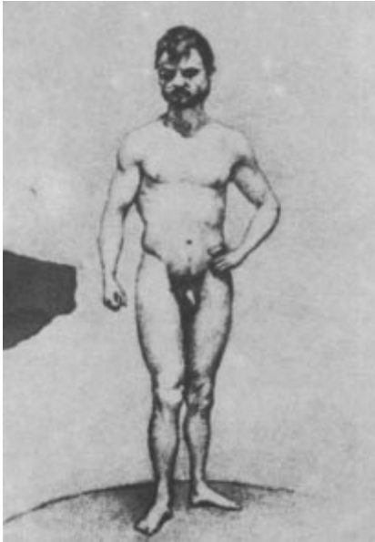
▲ « Athlète ». Noir et blanc, 1895. Dessin à la mine de plomb. Premier dessin réalisé par Picasso pour son examen d'entrée à l'École des Beaux-Arts de Barcelone, lorsqu'il n'avait que 14 ans. Musée Picasso de Barcelone.

il s'initia à la peinture grâce à son père qui était professeur de dessin, à l'instar de tant d'enfants qui font leurs premières armes sportives en compagnie ou sous l'œil vigilant de leurs parents. A l'âge où le sportif commence à vivre la magie du sport collectif, à ressentir l'attrait du jeu en équipe, Picasso arriva à Barcelone, à quatorze ans, en 1895 ou