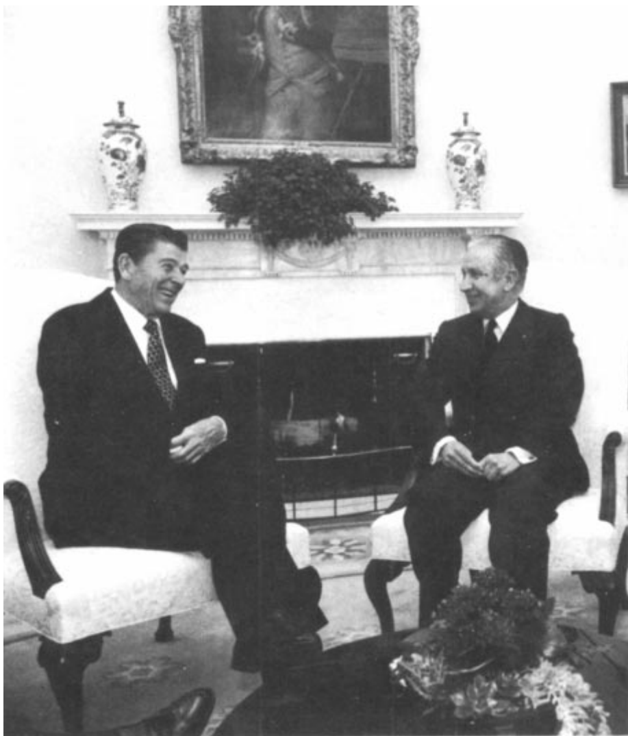
29 janvier 1982 à la Maison Blanche le Président du CIO. M. Juan Antonio Samaranch, est reçu par le Président des Etats-Unis d'Amérique, M. Ronald Reagan.