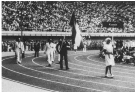
1976 - Montréal : la délégation du Koweït.