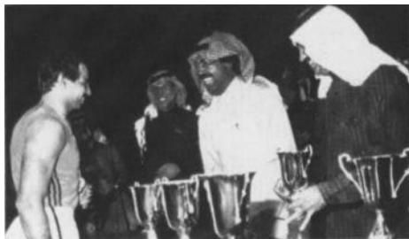
Le Cheik Fahid Al-Ahmad Al-Sabah récompensant les meilleurs athlètes de son pays.