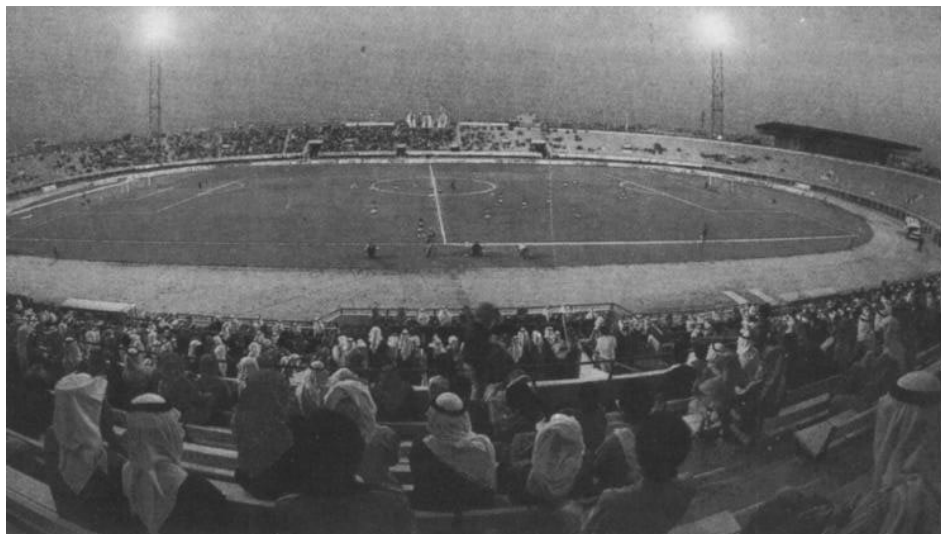
Le stade de Koweït : 30 000 places.