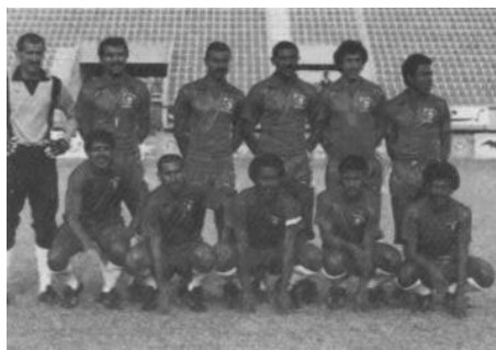
1982 - L'équipe du Koweït, qualifiée pour la phase finale de la Coupe du monde.

Dés lors, une délégation du Koweït, essentiellement masculine, fut présente à chaque célébration d'olympiade. A ce jour, le Koweït n'a encore jamais participé aux Jeux d'hiver.