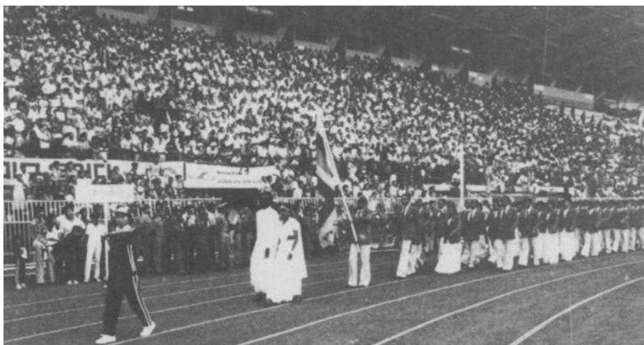
La délégation du Sri Lanka en 1978 aux Jeux Asiatiques.