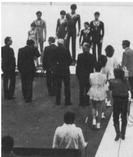
Les lauréats de la catégorie « couples ».

● Les championnats du monde juniors se dérouleront du 22 au 24 avril 1983 à Porto-Rico (PUR).