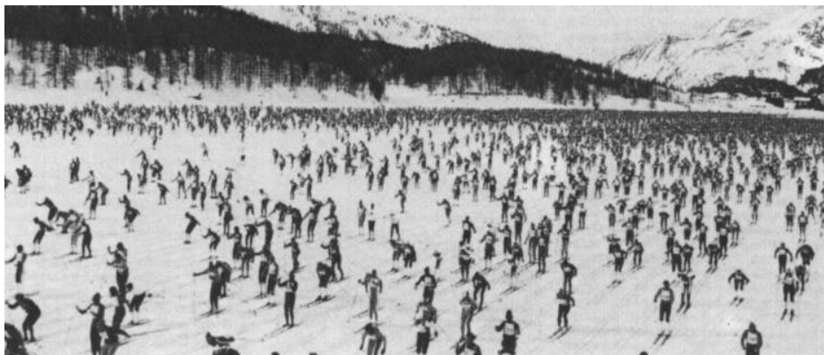
Dans l'Engadine (Suisse) : 10 000 skieurs au départ.

19 sites de 12 pays différents accueilleront les 26 rencontres de la coupe du monde de saut à skis et Planica en Yougoslavie sera le siège de la finale le 27 mars. Le classement dans chaque épreuve se fera là aussi sur la base de vingt-cinq points pour les quinze premiers, seules les quinze meilleures épreuves comptant pour la coupe (7 de la première manche, 8 de la seconde).