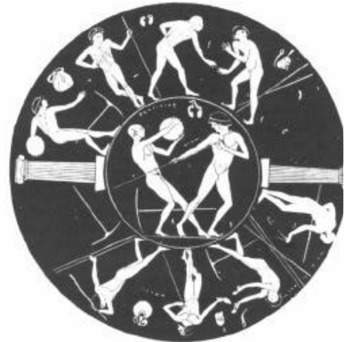
Intérieur de palstre: le disque, le javelot, le pancrace et le saut représentés sur un vase grec.

Il est possible que Dover ait voulu s'opposer aux progrès des Puritains. Il est possible qu'il ait voulu faire valoir les vertus des Catholiques. Mais il n'est pas facile de manipuler les esprits, surtout ceux des Cotswoldiens, et surtout dans un but de propagande politique. Même si ses intentions étaient avant tout politiques lorsqu'il organisait ses manifestations, celles-ci devaient d'abord faire l'effet d'une merveilleuse kermesse de neuf jours, d'autant plus que Dover était un enfant du pays. Il est vraisemblable que l'initiative de Dover avait été inspirée par le souci de réveiller l'esprit national. Or, pour de nombreux esprits de l'époque, un tel réveil était lié forcément à des festivités comme celles des Grecs, dont on avait une vision idéalisée.