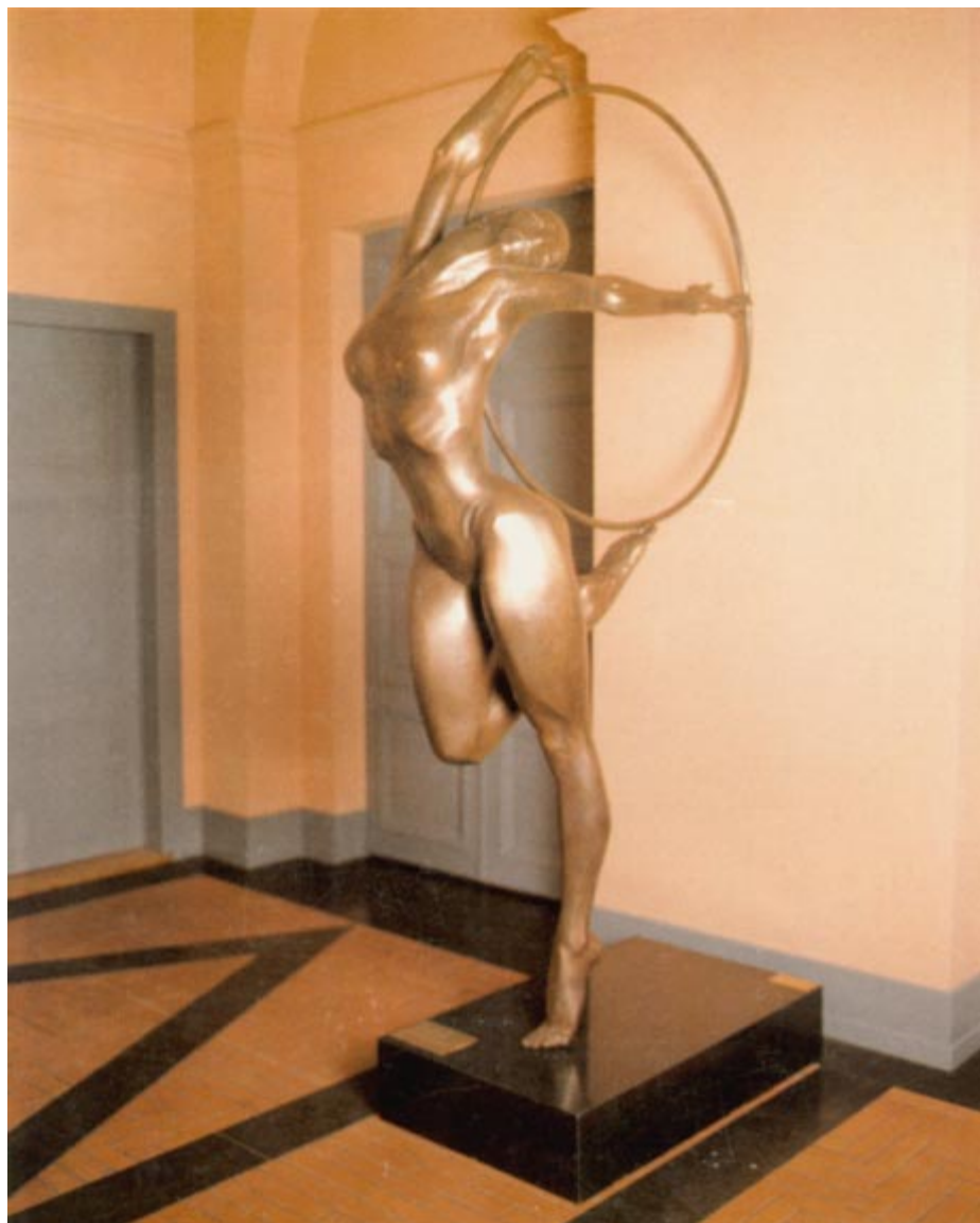
Sculpture de Gueorguy Tchapanov, offerte au CIO par le CNO de Bulgarie