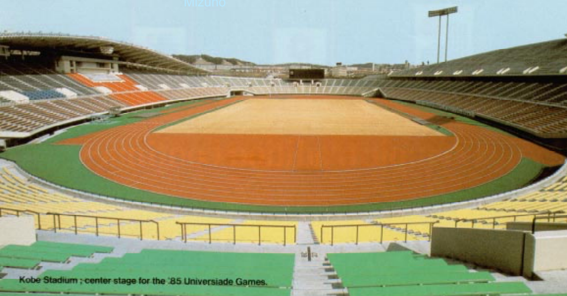
Kobe Stadium ; center stage for the '85 Universiade Games.