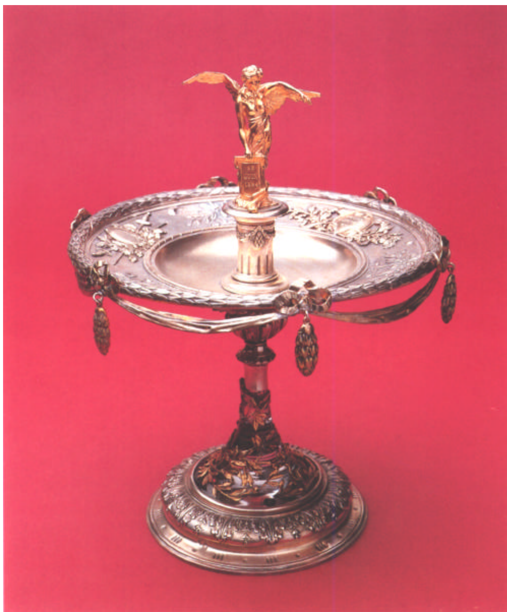
La Coupe Olympique qui vient d'être attribuée au Comité National Olympique de la République populaire de Chine pour les mérites éminents de son action en faveur de la promotion du sport dans les pays en développement, est une création du baron Pierre de Coubertin qui date de 1906. Le titulaire annuel de cette récompense recoit une reproduction de cette coupe dont l'original est conservé au Musée olympique.