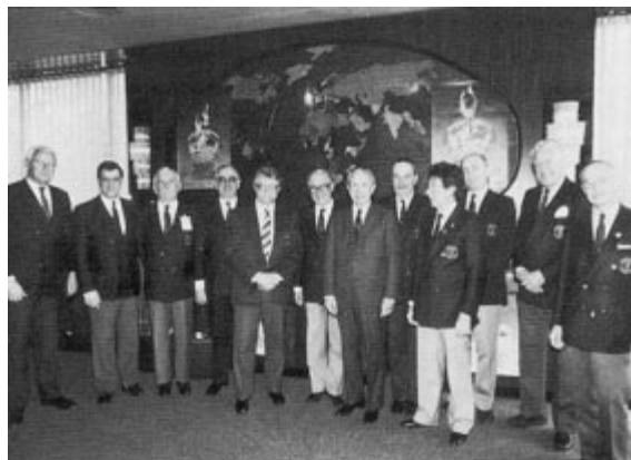
Le Président du CIO (au centre) entouré des membres du conseil de l'ISU.

□ L'Américain Pablo Morales a repris son titre de nageur le plus rapide du monde au 100 m papillon en réalisant le 23 juin dernier le temps de 52"84. Il avait établi le premier record de 53"23 en juillet 1984, record battu peu après par Michael Gross (FRG) au cours des Jeux de la XXIII e Olympiade (53"08) et gardé par ce dernier depuis lors. Pablo Morales avait remporté la médaille d'argent du 100 m papillon derrière Michael Gross, ainsi qu'une médaille d'or au relais 4 x 100 m 4 nages et une troisième d'argent au 200 m 4 nages individuel.