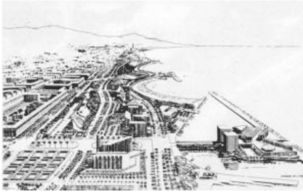
Projet du parc del Mar.

ment rendu compte de l'urgente nécessité de redévelopper les zones côtières et ont déjà commencé à les aménager.