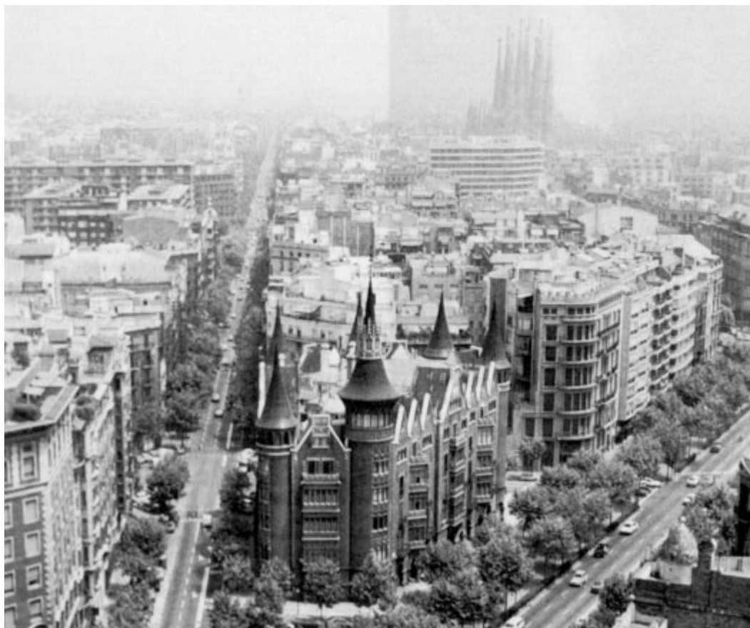
Les larges boulevards et l'architecture du Barcelone moderne. Au premier plan, la « Casa de les Punxes » de Domenech i Montaner (autour de 1900) ; au fond, la « Sagrada Família » de Gaudi.