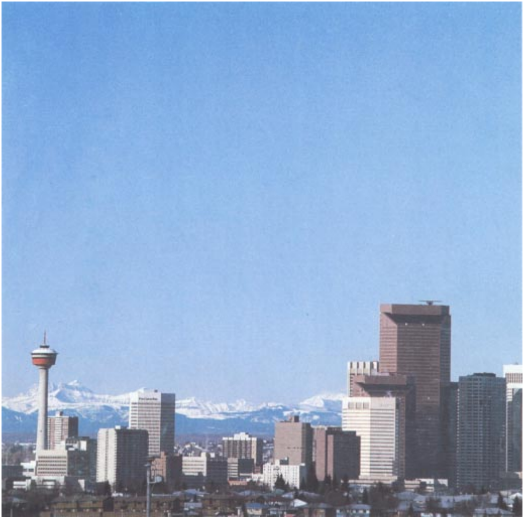
Calgary, la ville des XV es Jeux d'hiver, attend déjà ses invités olympiques.