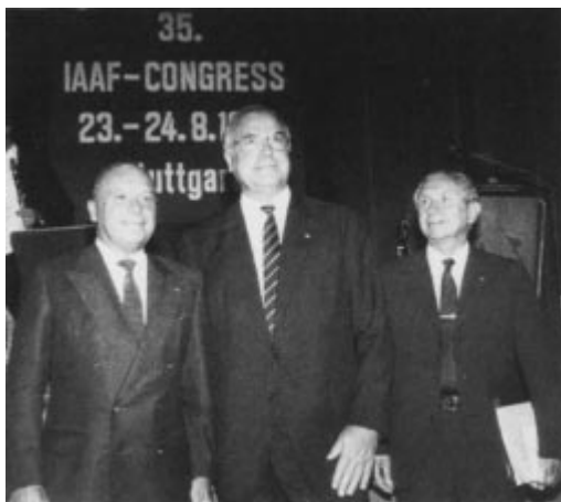
Le président de l'IAAF et le Président du CIO entourant le chancelier d'Allemagne fédérale, M. Helmut Kohl.

En collaboration avec la Fédération d'athlétisme du Bade-Wurtemberg et la ville de Stuttgart, capitale de ce Land, la Fédération allemande d'athlétisme a créé un comité d'organisation qui comprenait également des représentants du Land Bade-Wurtemberg et de l'université de Stuttgart.