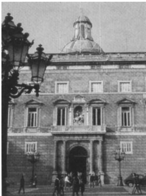
Le siège de la Généralité de Catalogne.

La famille olympique , qui comprenait un marquis et cinq comtes, arriva à Barcelone dix jours après la proclamation de la République, dans une ambiance d'enthousiasme populaire pour le nouveau régime. Le maire, Jaume Aiguadé comme le président de la Generalitat, Francesco Macià, traitèrent les illustres visiteurs avec le maximum d'égards pour qu'ils emportent avec eux une bonne impression de la ville.