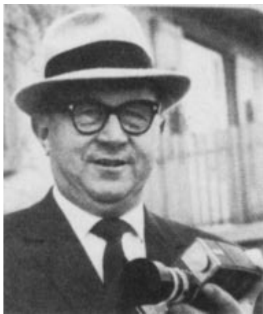
Hans Baumann, président de l'IHF de 1950 à 1971.

Le Congrès de 1986 de l'IHF s'est déroulé à Saly/M'Bour (SEN), du 25 au 28 octobre, avec la participation de représentants de cinquante-deux fédérations membres. Les fédérations nationales du Niger, du Tchad et du Bangladesh ont été nouvellement admises au sein de la Fédération Internationale, tandis que le Costa Rica s'est vu accorder le statut de membre provisoire. A ce jour, l'IHF compte quatre-vingt-dix-huit pays membres; deux membres provisoires et une vingtaine de fédérations devraient être affiliés sous peu. Le handball est pratiqué dans 129 pays par près de 4,8 millions de joueurs de 225 000 équipes environ au total, sans compter les écoles, les universités et les armées.