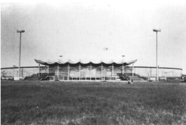
Le stade de la Démocratisation à Brazzaville.

disciplines. Depuis lors, la situation financière très difficile des pays de la zone remet en cause l'organisation des Jeux. Ainsi, le Zaïre, désigné pour abriter les 3 es Jeux en 1985, s'était désisté faute de financement. Ce forfait du Zaïre a occasionné un passage à vide qui a sérieusement entamé la compétitivité des pays de la zone. Les Jeux de Brazzaville vont-ils relancer les compétitions sous-régionales ? Le nombre très restreint (six) des disciplines programmées donne à ces Jeux un caractère très modeste, comparativement aux Jeux de Libreville et de Luanda. Il faut craindre qu'on s'achemine vers la mort de ces Jeux, les trésoreries nationales ne pouvant supporter l'organisation des Jeux à grande échelle. Il faudra certainement trouver une formule pour sauver les Jeux et éviter l'image des Jeux Continentaux qui n'en sont qu'à trois éditions depuis vingt-deux ans !