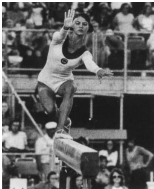
Ludmila Tourischeva, la gymnaste, poursuit des études théoriques sur son sport.