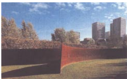
Oeuvre de l'Américain Richard Serra.