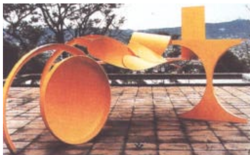
Oeuvre du Britannique Anthony Caro.