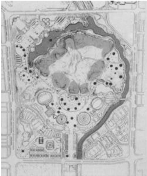
L'emplacement des sculptures dans le Parc olympique.

Israël, Italie, Pays-Bas, Pérou, Roumanie, Union soviétique, Espagne, Suède, Yougoslavie, auxquels se sont joints deux artistes coréens; pour le second : République fédérale d'Allemagne, Argentine, Australie, Belgique, Brésil, Canada, Danemark, USA, France, Japon, Mexique, Pologne, Suisse, Venezuela, Grande-Bretagne, Corée. M. Restany, créateur du nouveau réalisme et critique d'art reconnu, a souligné, à l'occasion d'une interview, que cette manifestation d'un genre nouveau fera date pour l'originalité de son organisation et la qualité de ses participants. Deux tendances artistiques se dégagent des créations, l'une est la poursuite de la tradition décorative classique, l'autre est la création d'œuvres idéologiques et abstraites. Mais le plus important, a-t-il précisé, c'est que l'inspiration vienne du lieu de création. La plupart des artistes ont ressenti une forte impression de Séoul et l'inspiration s'est développée graduellement chaque jour.