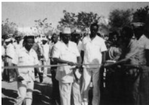
L'inauguration du stade Ali Sabieh à Djibouti.