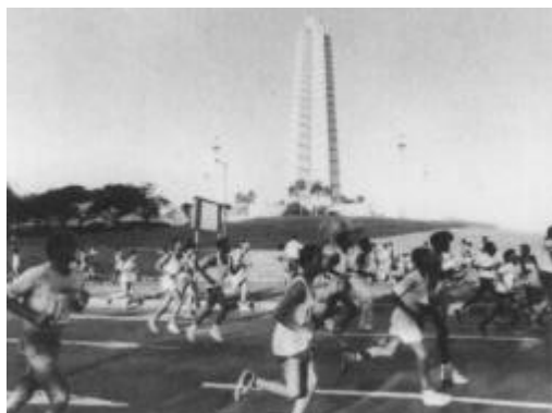
Le marathon de novembre dans les rues de La Havane.

Autre initiative dynamique : les « Cercles des grands-parents ». Il s'agit de groupes de santé pour citoyens du troisième âge, encadrés par des entraîneurs et des médecins, dont le but est d'encourager la poursuite d'une activité sportive. Près de cinquante mille participants l'an passé ont déjà prouvé que le sport n'est pas réservé uniquement aux jeunes.