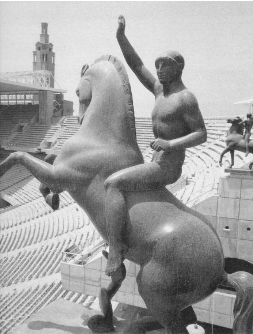
Deux montures « noucentistes » qui rappellent avec fougue son origine à ce stade flambant neuf.

chissant ce qui semblait être le seuil du temps, les athlètes se trouvèrent de l'autre côté devant un trou de 11 mètres. L'arc d'origine n'est plus maintenant que simple décoration. Même les sauteurs à la perche décidèrent de faire demi-tour et d'utiliser l'autre entrée !