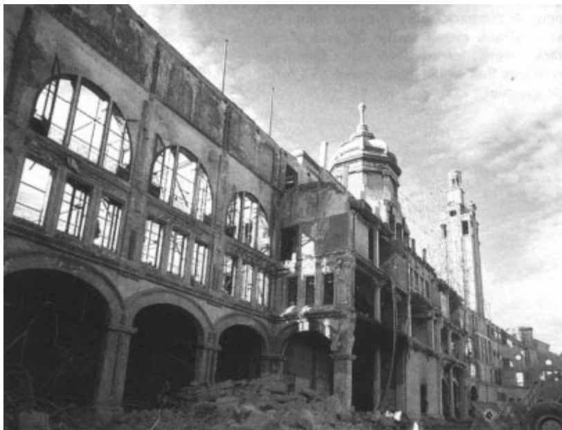
On n'a gardé que les murs...

De 1929 à 1936, le stade devint le théâtre de quelques âpres combats, notamment la rencontre entre Max Schmelling et Paulino Uzcudum dans le cadre du championnat du monde de boxe poids lourds et