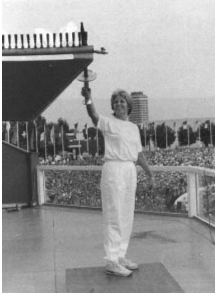
Heide Rosendahl, double médaille d'or d'athlétisme aux Jeux de 1972, a allumé la flamme de la XV e Universiade.

En basketball, où le nombre de joueurs par équipe était limité à seize, les USA, l'URSS, le Canada et la République fédérale d'Allemagne ont d'entrée de jeu pris l'avantage pour se lancer dans la course aux médailles. L'équipe américaine dont la dernière victoire à un tournoi d'universiade, remontait à 1981 à Bucarest (ROM), a fini par s'imposer par une victoire en finale par 88 à 80 contre l'URSS.