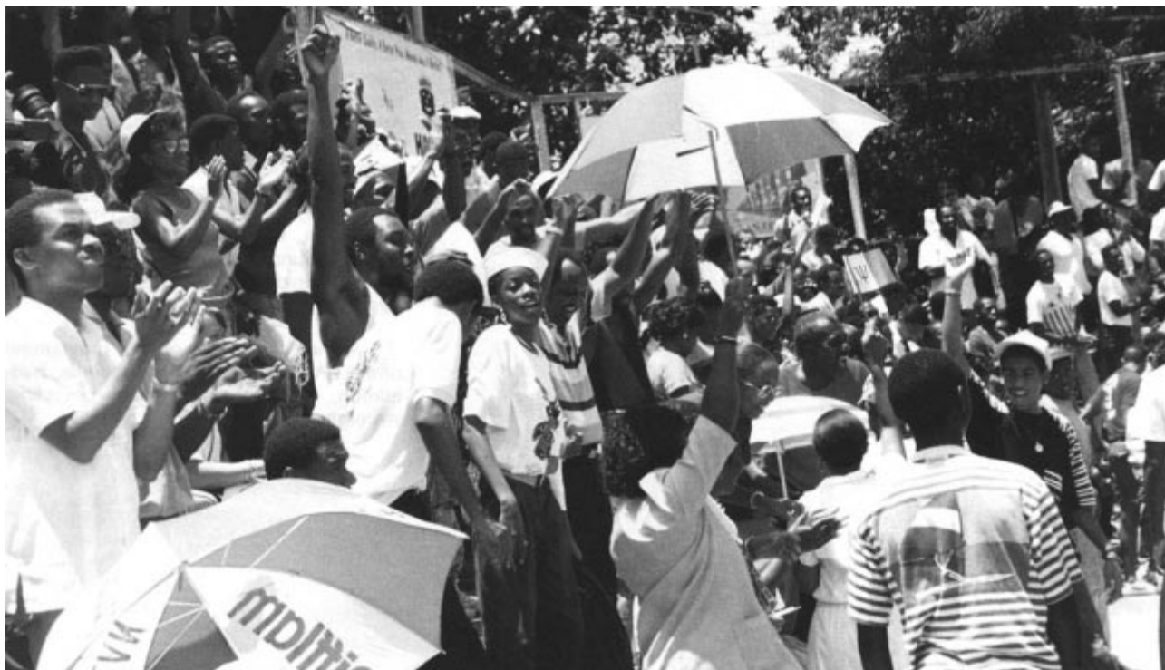
Une foule enthousiaste à la Barbade pour les XVII es Jeux Carifta.

Des Jeux sous le soleil des Caraïbes, qui du 19 au 22 août 1989 ont remporté un véritable triomphe.