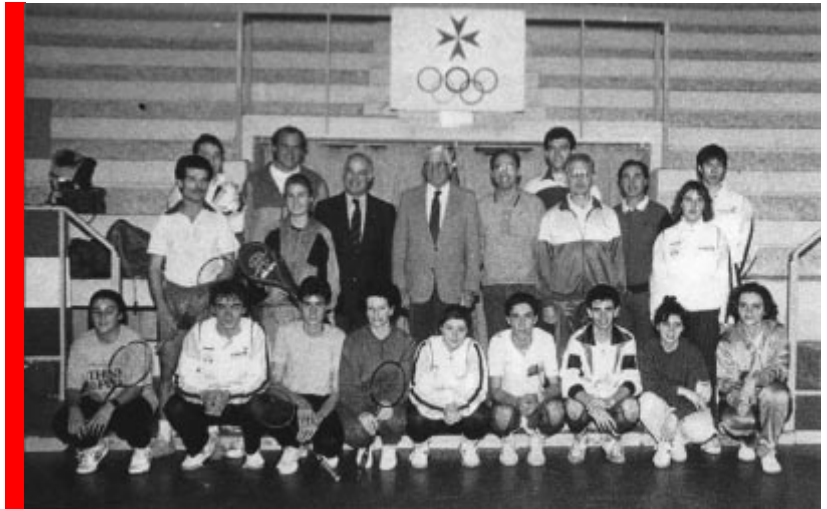
Participants à un cours de Solidarité de badminton à Malte.

M. Karl-Heinz Wehr, secrétaire général de l'AIBA, attribue en partie cette augmentation de la sécurité au meilleur entraînement des boxeurs et arbitres. Toutefois, le plus grand facteur, ajoute-t-il, est le port obligatoire du casque de protection dans les compétitions internationales. Celui-ci s'est révélé particulièrement efficace en raison des nouveaux matériaux utilisés sur le marché, tant pour les gants que pour les casques, qui réduisent l'impact des coups de manière significative. Après le succès de cette mesure, l'AIBA a décidé que, à compter du 1 er janvier 1991, les casques seraient obligatoires au niveau national et international.