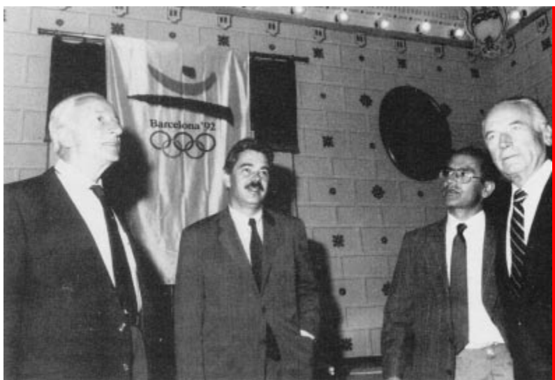
MM. Sergio Orsi et Otto Bonn (à gauche et à droite) visitent les installations olympiques à Barcelone en compagnie de M. Pasqual Maragall.

Le tirage au sort pour les matches de la Coupe du monde 1990 qui se dérouleront du 8 juin au 8 juillet a été effectué. Ci-dessous, liste des matches de première division :