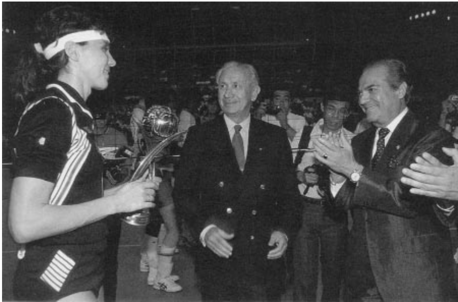
Une équipe de vedettes pour gala mondial de la FIVB à Singapour.