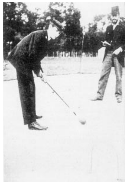
Le croquet ne fut inscrit qu'aux Jeux de 1900 à Paris, trop peu populaire. Le jeu de lacrosse n'est apparu que deux fois sur la scène olympique.

Lors des Jeux de 1900 et 1904, le golf attira peu de concurrents. La popularité