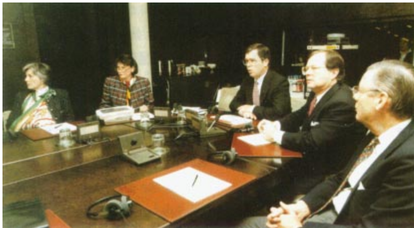
La délégation d'ACOG présentant son rapport devant la commission exécutive.

football est définitivement prévue à Athens, à 113 km au nord-est de la ville olympique, dans le stade de Sanford l'université locale (85.000 places).