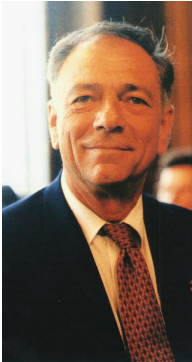
Le prince Alexandre de Merode, président de la commission médicale du CIO

La commission pour le programme est quant à elle réorganisée, l'idée étant de constituer deux groupes d'experts, à désigner: pour