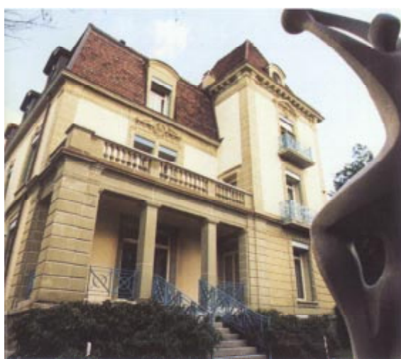
Le siège de la FIVB.

dent Acosta espère aujourd'hui que «ce tournoi figurera au calendrier des compétitions internationales» . «Parallèlement, des discussions sont actuellement en cours avec les villes suisses des rives du lac Léman afin de créer un circuit international de volleyball de plage» .