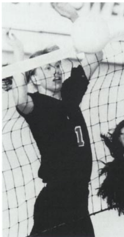
Match de volleyball...