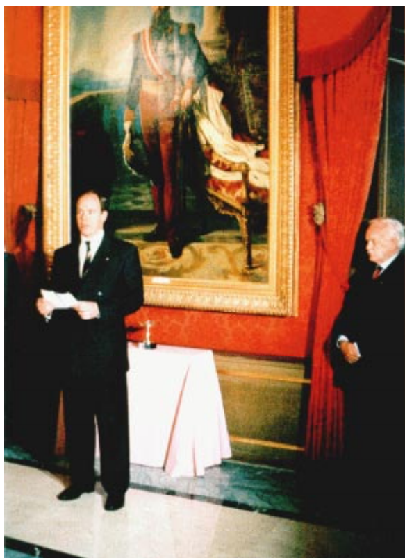
Albert de Monaco, membre du CIO, lors de la remise de la Coupe Olympique au CNO monégasque.