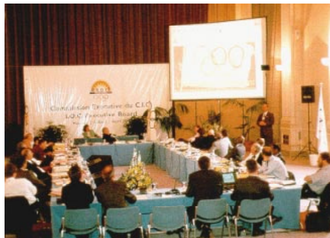
La commission du CIO en séance.

Pour les Jeux de l'olympiade en 2004, le principe de sélection d'un certain nombre de finalistes, au même titre que pour les Jeux d'hiver en 2002, pourrait être envisagé. Le 1er juin, le CIO invite les CNO à faire acte de candidature pour ces Jeux