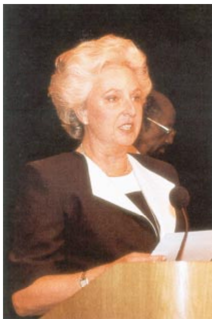
S.A.R. l'Infante Doña Pilar de Borbon (Espagne)