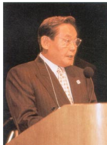
Kun Hee Lee (Corée)

Membre de la commission du sport pour tous du CIO (1992-); Membre de la commission d'évaluation du CIO pour les Jeux de la XXVIIIe Olympiade en 2004 (1995-).