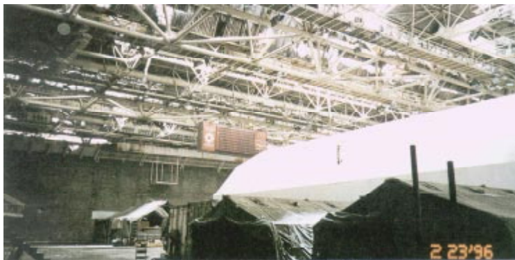
Vue de l'intérieur du stade de Zetra.

En compagnie de Stjepan Kljuic et Izudin Filipovic, respectivement président et secrétaire général du CNO, la délégation a visité les deux installations dont le CIO envisage la rénovation : le stade de Zetra, palais de glace couvert qui a accueilli la cérémonie de clôture des Jeux et le stade olympique de Kosevo, dont la reconstruction sera financée à la fois par le CIO et l'IAAF qui souhaite y organiser un meeting d'athlétisme pour la paix en septembre prochain. Par ailleurs, la délégation du CIO a été reçue par le Premier ministre de Bosnie-Herzégovine, Hasan Muratovic, lequel a réaffirmé le soutien de son gouvernement au projet