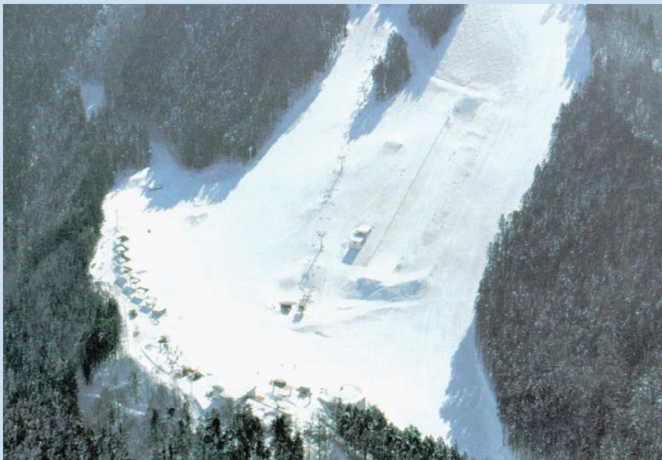
Le site de half pipe de Kanbayashi.

Cinq juges notent les performances des athlètes. Ils peuvent attribuer un maximum de 10 points dans leur spécialité respective : technique standard, rotation, dynamique, réception et mérite technique.