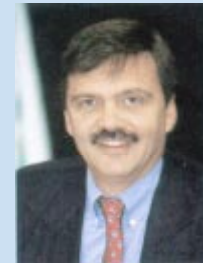
René Fasel, président

Pour la première fois, des joueurs professionnels de la Ligue Nationale de Hockey (National Hockey League - NHL)