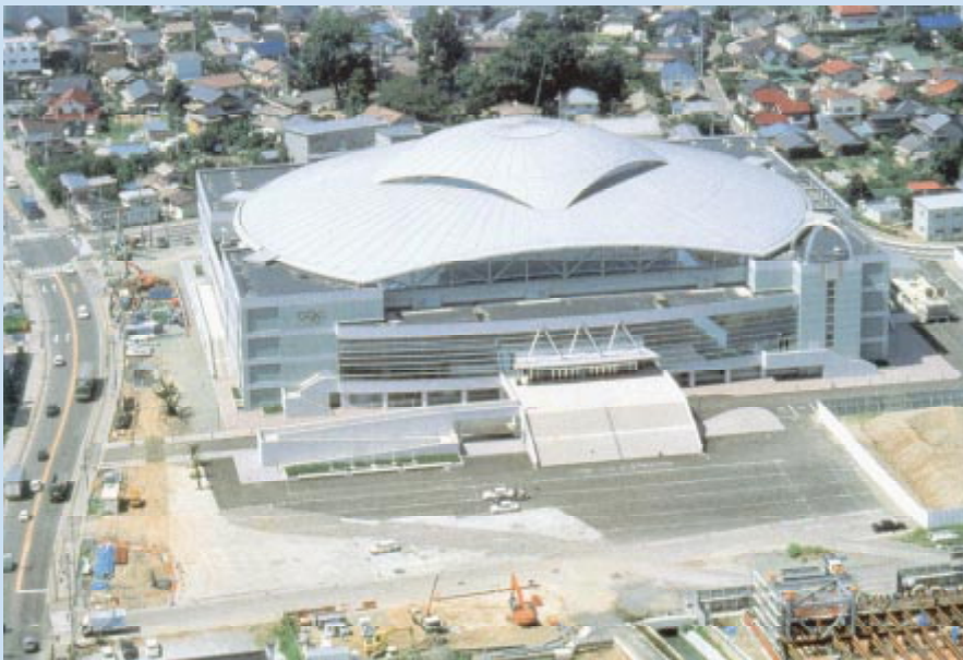
Le stade 'Big Hat'.

Pour la première fois également, le hockey sur glace féminin sera au programme des Jeux Olympiques d'hiver de Nagano. Les équipes féminines ont commencé la compétition avec les Championnats du monde en 1990. La fédération japonaise de hockey sur glace a enregistré pour la première fois des équipes féminines en 1981. Depuis, la popularité du hockey sur glace féminin n'a cessé de croître. Aux Jeux de Nagano, participeront des équipes du Canada, de Chine, des Etats-Unis d'Amérique, de Finlande, du Japon et de Suède.