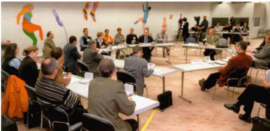
Table ronde à l'AOS sur le dopage.

La Commission technique de lutte contre le dopage de l'AOS a été chargée d'élaborer des mesures. Surtout pour trouver une solution dans les troisième et quatrième domaines, une coopération internationale est indispensable.