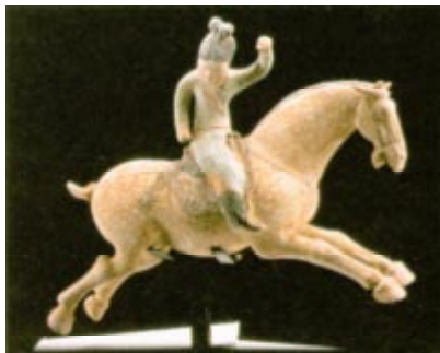
Jeune femme joueuse de polo se préparant à frapper la balle. Dynastie Tang, VIII e siècle av., Musée national des arts asiatiques Guimet, Paris.

de notre ère), généralement considérées comme les sommets de la culture chinoise ancienne, le statut des femmes fut inférieur à celui des hommes et la pratique des pieds bandés empêcha toute activité physique vigoureuse. La littérature précise, cependant, que les femmes dansaient et que certaines excellaient dans l'art du sabre. 9 La sculpture pour sa part montre des femmes dansant et jouant de la musique, tandis que d'autres pratiquent un jeu de balle au pied, connu sous le nom de cuqiu , et à une forme de polo appelé jiqiu . 10 (illustration ci-dessous). La littérature enseigne qu'un jeu, connu sous le nom de Ch'iu Ch'ien (ressemblant beaucoup à un déhanchement d'enfant), était devenu très populaire au sein des dames de la cour impériale de la dynastie Han. 11