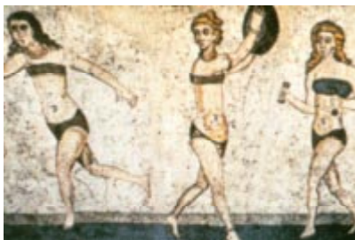
Mosaïque de la Villa Romana de Casale, place Armerina.

Par comparaison avec la Grèce, les femmes, dans la civilisation romaine, jouissaient d'une plus grande liberté économique, politique et sociale. Les peintures montrent des femmes étrusques jouant de la musique et dansant, comme elles le faisaient depuis des siècles. Plus tard les Romaines furent autorisées à assister aux courses de chevaux et de chars du Circus Maximus, aux combats de gladiateurs du Colisée et à prendre des bains aux thermes, les bains publics. On en a conclu que certaines femmes furent également autorisées à participer à des exercices, comme semblait le montrer la mosaïque du IV e siècle connue sous le nom de « Filles en bikini » de la place Armerina en Sicile, qui montre des femmes courant, utilisant des haltères, jouant avec une balle, lançant le disque. 21 (ci-dessous).