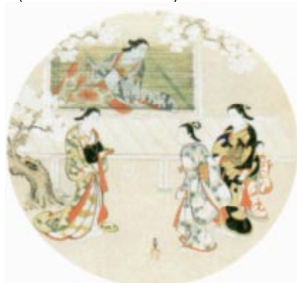
Jeunes filles tapant dans un ballon. Période Edo par Tsuneyuki (1676-1741). Freer Gallery of Art, Smithsonian Institution, Washington, D. C.

A cette époque, commencèrent les premières tentatives d'institutionnalisation des sports en Europe, cependant la plupart des activités physiques récréatives restèrent largement informelles et associées à des jours fériés, des fêtes et autres célébrations. 30 Tandis que la participation des femmes était toujours moindre que celle des hommes, de nombreuses preuves indiquent qu'elles continuèrent, comme au cours des siècles précédents, à en pratiquer un grand nombre. Spectatrices aux courses de chevaux, aux combats professionnels, aux matches de cricket en Angleterre, elles jouaient aux boules, au billard, au palet et à la raquette et parfois au cricket. Quelques-unes d'entre elles furent des boxeuses professionnelles, des lutteuses et des randonneuses. 31 Des estampes et des peintures de plusieurs pays en Europe présentent des femmes patinant, glissant en luge (ou en bob sur la glace), dansant, montant à cheval, chassant et jouant à divers jeux de société. Les oeuvres de la classe dirigeante française et allemande dépeignent des femmes à bord de ballons à air chaud, des dames de sang royal en Inde apparaissent à la chasse aux animaux sauvages, et au Japon les femmes de la classe supérieure sont montrées jouant au football. 32 (illustration ci-dessous).