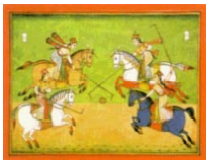
Une reine et ses esclaves féminines jouant au polo. Mughal Mss. Dārābnāma , vers 1580. British Library, Londres (Or 4615). Repris de «The Sporting Woman» de Sally Fox.

En dehors de l'Europe de la Renaissance, des peintures montrent des femmes participant à diverses activités au cours du XVIe siècle. Des peintures montrent des skieuses nordiques en train de chasser, des Japonaises pêchant et des Indiennes jouant au polo. 29 (illustration ci-dessous)