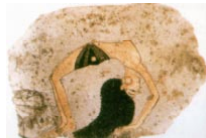
Acrobate du musée égyptien de Turin, Repris de «The Sporting Woman» de Sally Fox.

des femmes dansant, jouant de la musique sur divers instruments et sur quelques pièces de sculpture, on voit des femmes nageant. Les objets égyptiens dont les motifs sont des acrobates, féminines pour la plupart et qui, semble-t-il, sont des danseuses professionnelles sont fréquents. 5 Une peinture sur un fragment de chaux datant de la XVII e dynastie du Nouveau royaume (vers 1567- 1320 av.) présente l'une de ces acrobates positionnée sur le dos (ci-dessous)