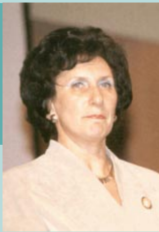
Irena Szewinska (Pologne), championne olympique aux Jeux des XIXe et XXIe Olympiades de Mexico (200 m) en 1968 et de Montréal (400 m) en 1976.