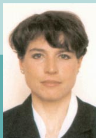
Manuela Di Centa (Italie), championne olympique de ski de fond (15 km et 20 km) aux XVIIes Jeux Olympiques d'hiver de Lillehammer en 1994.