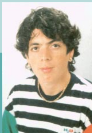
Hassiba Boulmerka (Algérie), championne olympique du 1 500 m aux Jeux de la XXVe Olympiade de Barcelone en 1992.