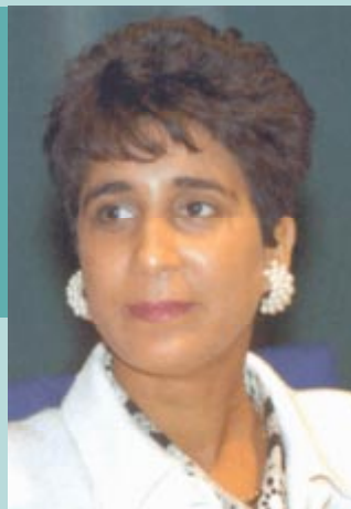
Nawal El Moutawakel (Maroc), championne olympique du 400 m haies aux Jeux de la XXIIIe Olympiade de Los Angeles en 1984.