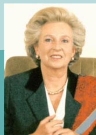
S.A.R. l'Infante Doña Pilar de Borbon (Espagne), présidente de la Fédération Equestre Internationale.