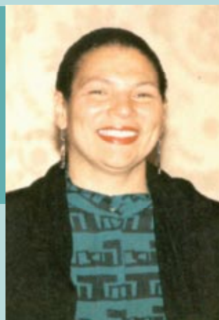
Anita L. DeFrantz (Etats-Unis d'Amérique), médaillé de bronze d'aviron aux Jeux de la XXIe Olympiade de Montréal en 1976.