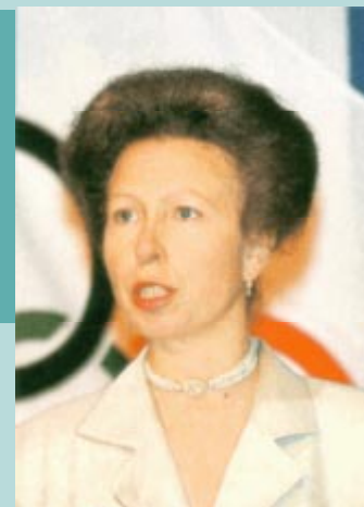
S.A.R. la Princesse Royale (Grande-Bretagne), participante aux épreuves équestres aux Jeux de la XXIe Olympiade de Montréal en 1976.