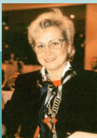
Vera Cáslavská (République Tchèque), championne olympique en gymnastique aux Jeux des XVIIIe et XIXe Olympiades de Tokyo en 1964 et de Mexico en 1968.