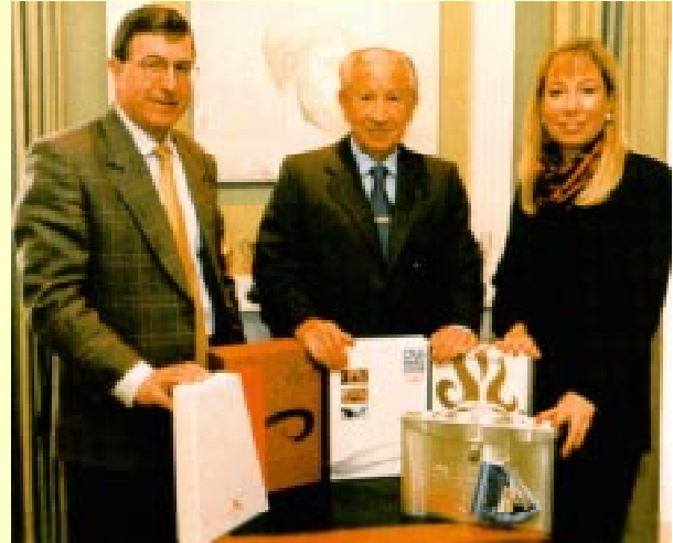
Présentation des dossiers des villes candidates. (de g. à d.), Gilbert Felli, le Président du CIO et Jacqueline Barrett.

capacités de chacune à organiser les Jeux Olympiques. Les dates des visites sont les suivantes: Beijing (21 – 24 février inclus), Osaka (26 février – 1er mars inclus), Toronto (8 – 11 mars inclus), Istanbul (21 – 24 mars inclus), Paris (26 – 29 mars inclus). La commission préparera un rapport qu'elle soumettra aux membres du CIO dans le courant du mois de mai 2001. La ville hôte des Jeux de la XXIXe Olympiade en 2008 sera élue le 13 juillet 2001 lors de la 112e Session du CIO à Moscou.