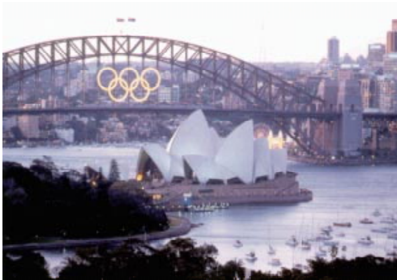
L'Opéra et le pont de Sydney aux anneaux olympiques.

Durant les Jeux, mais dans d'autres régions d'Australie, le tourisme s'est situé 10 à 15% au-dessous de son niveau habituel, en raison notamment d'une baisse remarquée sur le marché des vacances scolaires. Le secteur des