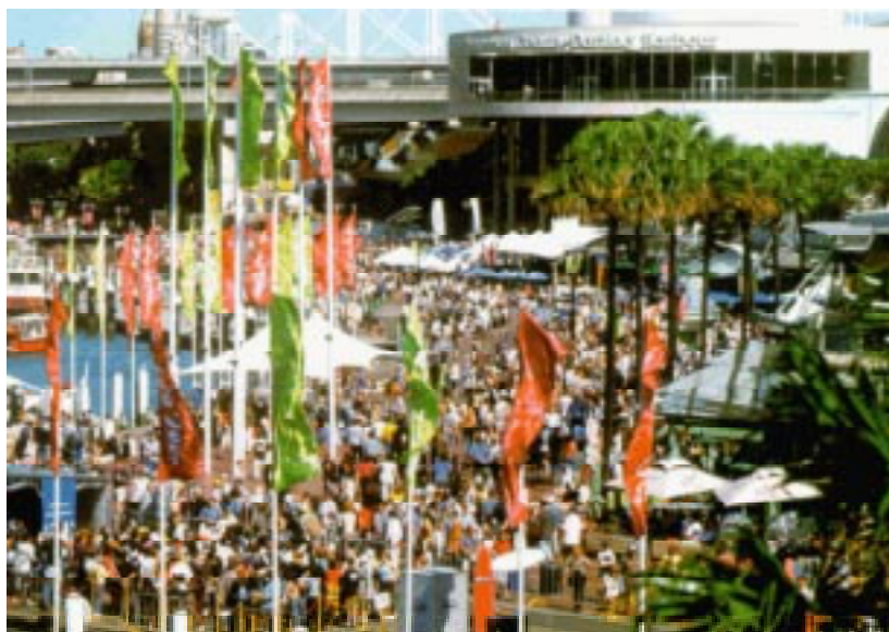
La foule à Darling Harbour.

ment habituel a été modifié du fait du caractère unique du marché des visiteurs olympiques. Certains restaurants ont prolongé leurs horaires d'ouverture, afin que des repas puissent être servis à toute heure, de midi à minuit, et pour pouvoir ainsi répondre aux demandes des spectateurs assistant aux épreuves. La majorité des établissements avait renoncé à majorer les prix, de manière à ne pas perdre la clientèle habituelle, néanmoins la plupart ont dû faire face à des frais plus importants. Du personnel supplémentaire devait, en effet, être engagé afin de pou-