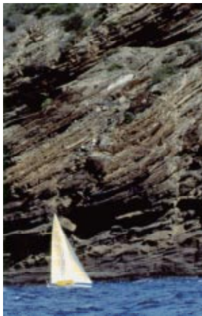
Naviguer pour découvrir.

La culture fait également l'objet de définitions multidimensionnelles. La définition classique se réfère à une entité qui comprend la connaissance, les croyances, l'art, la morale, le droit, les coutumes, ainsi que d'autres capacités et habitudes acquises par l'homme/la femme au sein d'une société. La culture a également été perçue en fonction des usages du peuple ou des objets significatifs et chargés de relations symboliques. D'autre part, la culture est considérée comme étant l'organisation de phénomènes ou de schémas de comportement reflétés par des objets et des outils chargés de sentiment. La culture a aussi été vue, avant toute chose, comme un processus intellectuel significatif pour l'esprit, perçu tel un modèle explicite et expérimenté au travers d'un usage particulier d'objets (Merril, 1969).