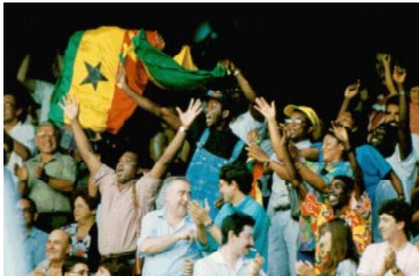
Joie des spectateurs.

Cependant, les consommateurs évaluent leurs motivations en fonction de la valeur de l'argent et des expériences qui peuvent être tirées ou revécues. Les résultats de valeur améliorent la motivation du consommateur et légitiment ses désirs, ainsi que la nature louable de l'effort culturel du tourisme sportif. En fait, ce sont généralement tant les motivations à court terme qu'à long terme qui guident le comportement du voyageur. Une expérience de festival sportif durant un week-end peut inciter un touriste sportif à refaire le même voyage l'année