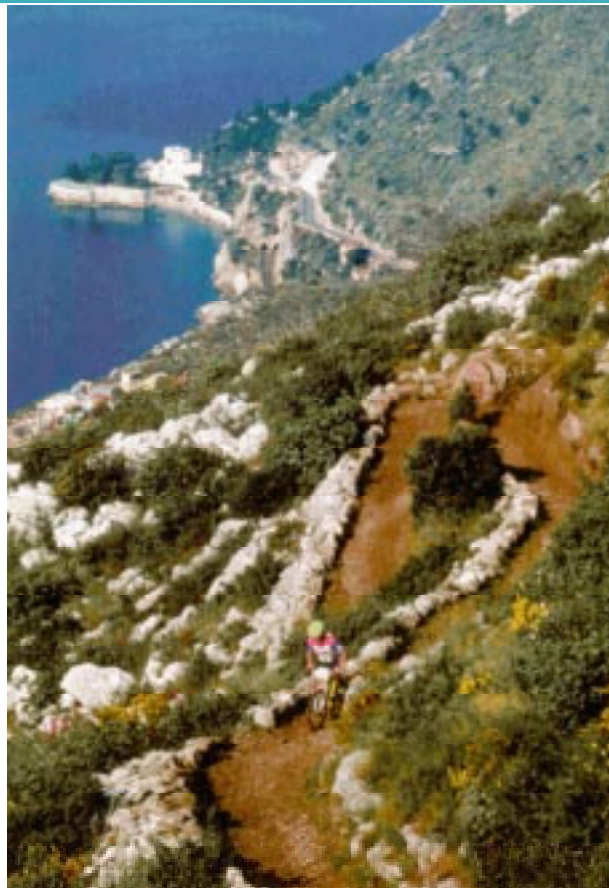
Sur /es chemins de montagne.

cipal qualificatif déterminant le tourisme sportif est le fait que le choix de la destination soit étroitement lié aux activités sportives, par le biais de stratégies commerciales et de la mise à disposition d'un programme en milieu sportif. D'autre part, les destinations touristiques dont les activités sportives ne sont que 'périphériques' par rapport à leur centre d'intérêt et à leurs efforts en matière de marketing sont considérées comme des destinations offrant des programmes sportifs et des activités uniquement à titre de facteurs 'secondaires' remplissant un rôle de soutien. Cela dit, il est également impératif de fournir une base à la définition du 'tourisme sportif' en s'appuyant sur la nomenclature d'activités sportives réelles plutôt que sur des définitions philosophiques. Par conséquent, le sport et le tourisme sont distincts en ce sens qu'il existe de nombreuses différences en matière de types d'activités, de modes de transport, de sites d'expérience,