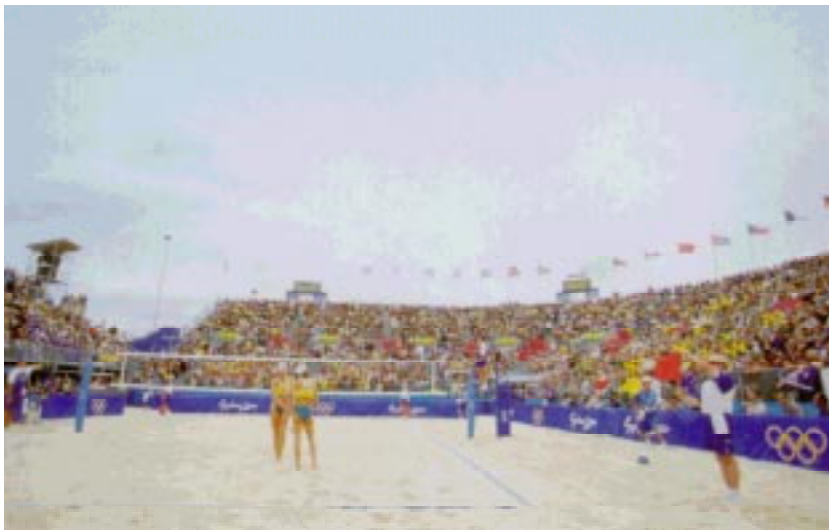
Tribunes pleines pour le beach-volley féminin à Sydney.

Les valeurs sociales constituent la motivation fondamentale d'un tel voyageur-consommateur. L'amour pour autrui, les relations d'attache, les interactions sociales et l'esprit de coopération en