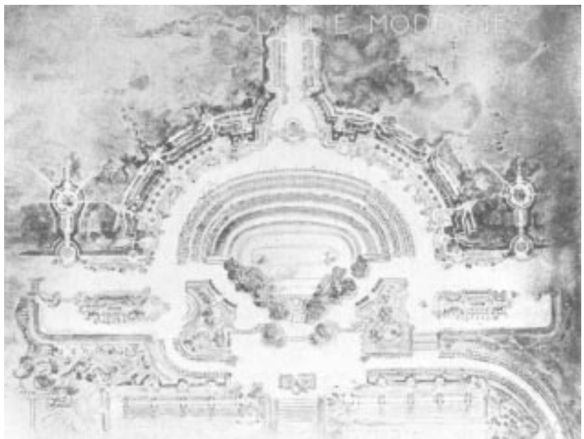
Plan du stade d'une Olympie moderne par les architectes Monod et Laverrière.

Le CIO reprenant ses activités à la fin de la Grande Guerre, Coubertin n'a plus le temps de s'occuper de l'IOL qui tombe en sommeil. Ce n'est qu'après son départ de la présidence du CIO, en 1925, qu'il peut à nouveau