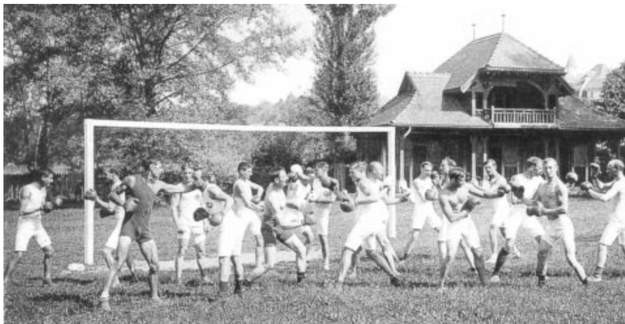
Séance d'entraînement de boxe à l'IOL.

L'idée de renforcer les liens du CIO et des milieux académiques de ce qui est désormais la «capitale olympique» est