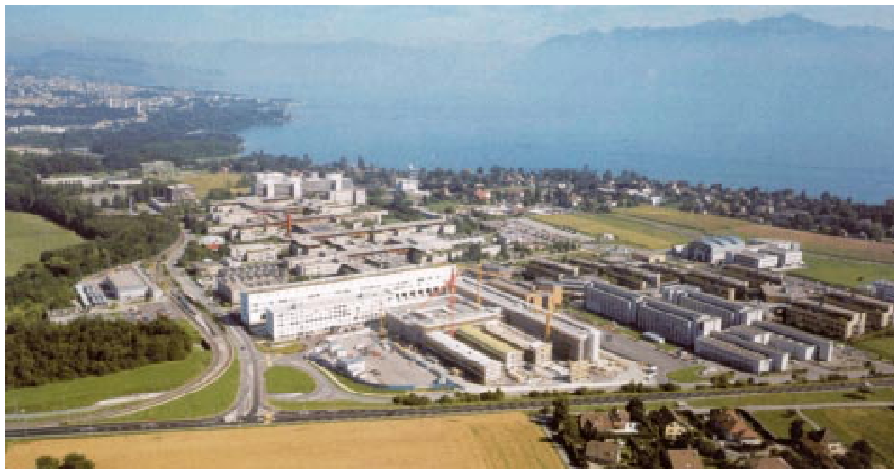
Site de l'EPFL à Lausanne.

11 Chappelet, Jean-Loup, "The World Academy of Sport Administration", Compte-rendu du 33e Congrès de l'AGFIS, Osaka, Japon, 15 octobre 1999.