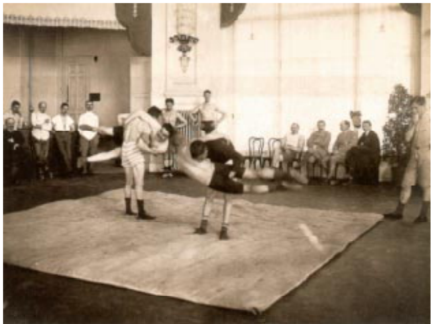
Leçons de lutte.